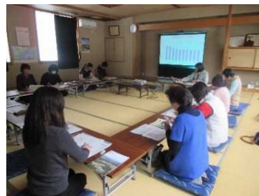
新たな農産加工品開発に向けた研修会の様子