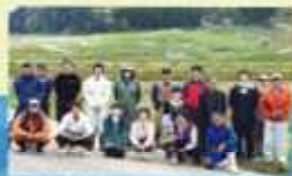
(有) グリーンファーム清里